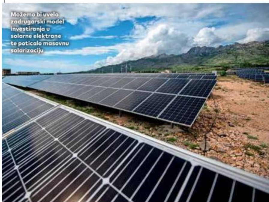
Možemo bi uvelo zadrugarski model investiranja u solarne elektrane te poticalo masovnu solarizaciju

SDP se zalaže da životni i neformalni partneri u svim pravima budu izjednačeni s bračnim i izvanbračnim partnerima, pa i u pitanju udomljavanja i posvajanja djece. Svim ženama žele omogućiti pristup postupcima medicinski potpomognute oplodnje, neovisno o njihovu bračnom ili partnerskom statusu. Uveli bi spolnu edukaciju u sve škole. Kontracepcija bi, ističu, trebala biti dostupna i besplatna. Pristup prekidu trudnoće na zahtjev mora ostati legalan, ali i postati dostupan i besplatan. Priziv savjesti zdravstvenih radnika ne smije utjecati na pravo pacijenata. Osnivanjem držav-