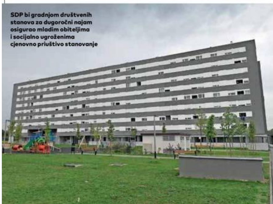
SDP bi gradnjom društvenih stanova za dugoročni najam osigurao mladim obiteljima i socijalno ugroženima cjenovno priuštivo stanovanje